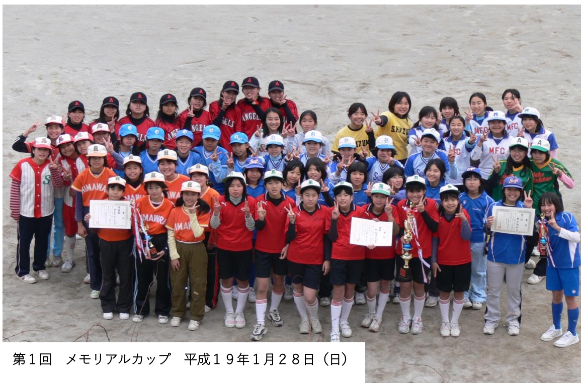
第1回 メモリアルカップ 平成19年1月28日(日)